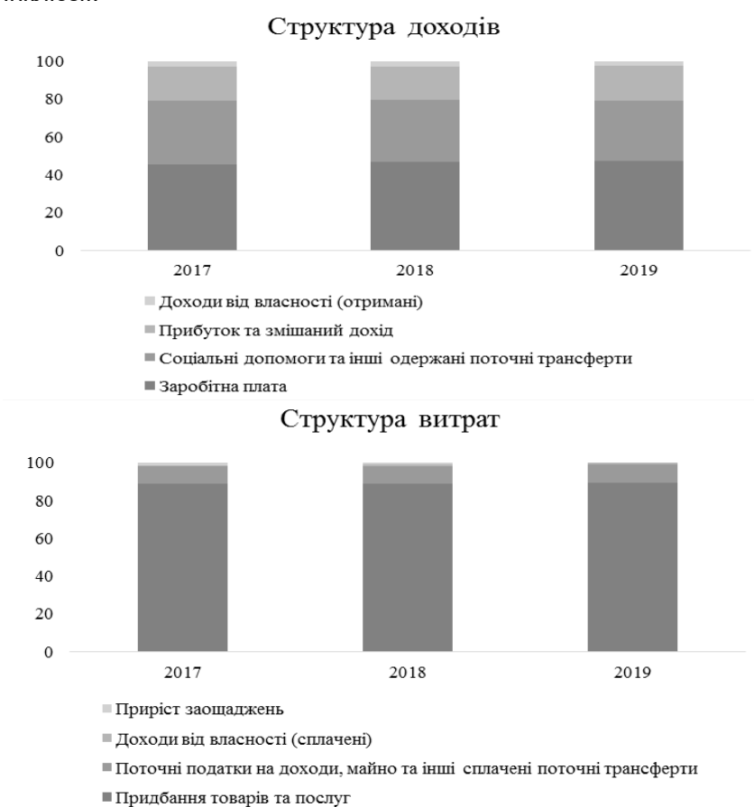
Рис. 1. Структура доходів і витрат населення, % Примітка: складено автором за даними Державної служби статистики України [26].

Одним з основних рушіїв приросту ВВП в Україні залишається споживання домогосподарств, що залежить, зокрема, від збільшення реальної заробітної плати та обсягів переказів з-за кордону. Попри коливання реальних доходів населення, заощадження, однак, мають історично низьку частку, тому напрям заощаджень є теж своєрідним резервом розширення фінансової інклюзії.